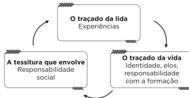
Figura 1: Categorias dos sentidos de trabalho.

E o processo teve como base a Unitarização (MORAES, 2011) que deve estar em conformidade com os objetivos da pesquisa, a qual está efetivamente direcionada à procura de uma compreensão mais ampla e válida dos fenômenos estudados, o que é a própria razão de se fazer pesquisa, ainda segundo Moraes (2011). E trata, certamente, daquilo que move esse estudo, já que procuramos uma compreensão do fenômeno investigado, seguindo assim os moldes da Análise Textual Discursiva, que se expressa em nosso traçado. Emergiram, então, três categorias, entendidas como sentidos de trabalho atribuídos pelos professores, são elas: A tessitura que envolve; O traçado da lida; O traçado da vida. Respectivamente, na figura 1 abaixo, A tessitura que envolve entrelaçada à profissionalidade docente, à obrigação moral, ao compromisso social (DAY, 2001); O traçado da lida entrelaçado às experiências (BONDÍA, 2002); O traçado da vida entrelaçado ao processo identitário do professor (NÓVOA, 2007), aos elos do processo (JOSSO, 2006) e à responsabilidade com a própria formação (PINEAU, 2010; GALVANI, 2002; CONTRERAS, 2002).